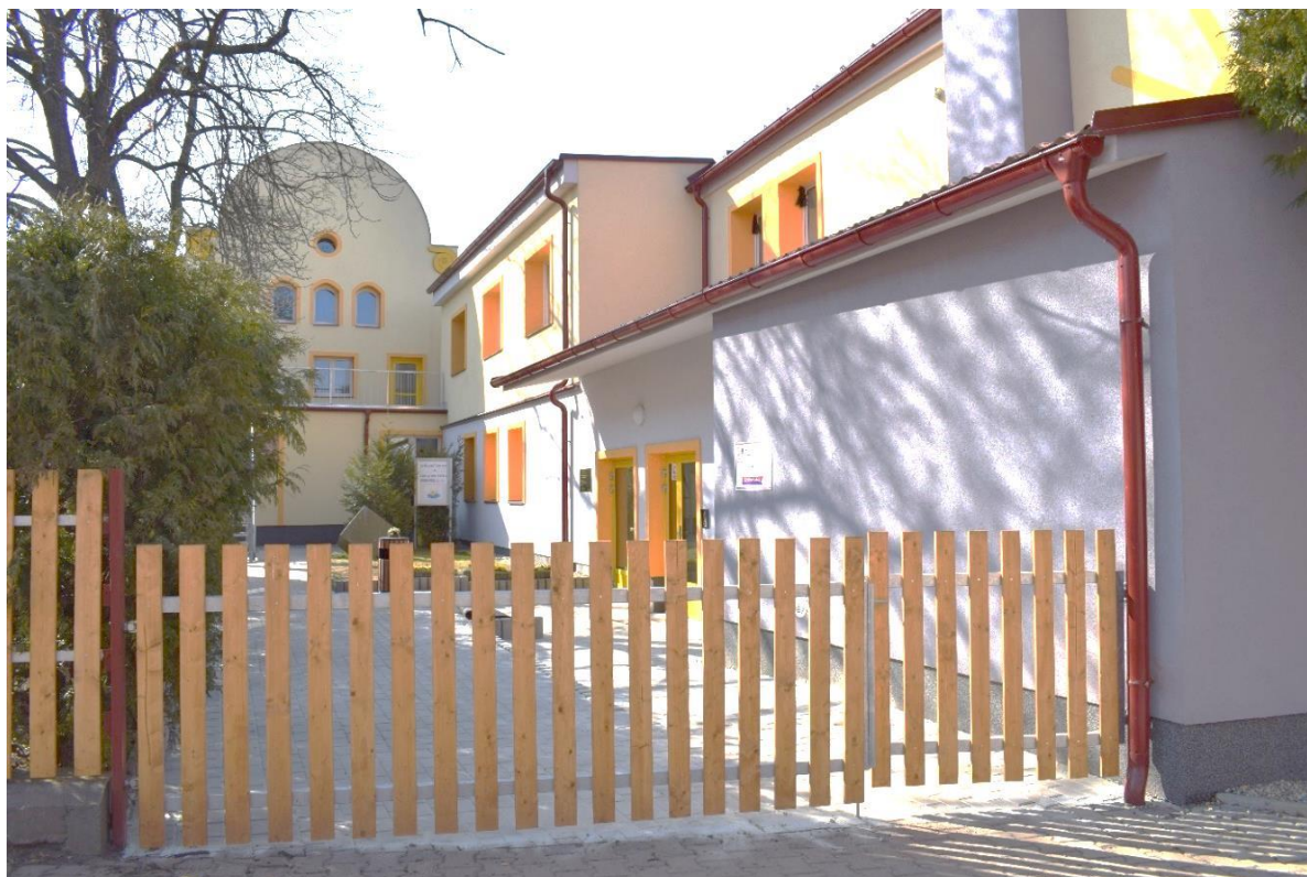
ZŠ Jesenice, Plzeňská 63