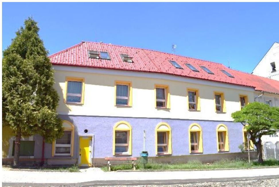
ZŠ Jesenice, Plzeňská 63