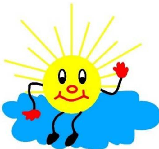
logo ZŠ Jesenice