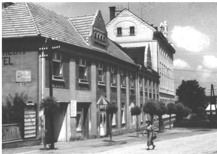
Podoba budovy školy mezi dvěma světovými válkami.