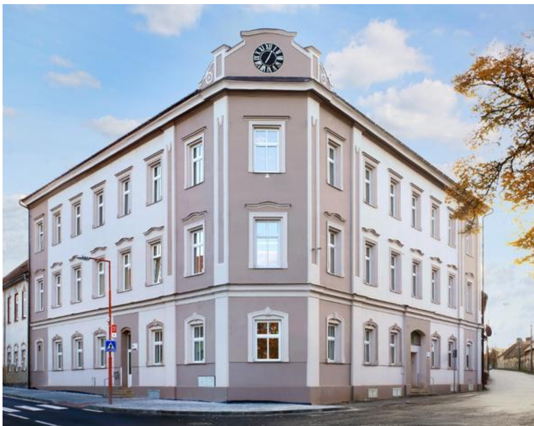
SŠ Jesenice, Žatecká 1

Pro dopravu žáků škola využívá svozové automobily. Dva s počtem osmi míst pro žáky a další pro přepravu čtyř a šesti žáků. Školní vozidla jsou určena k přepravě žáků do školy a ze školy, při školních výletech a exkurzích, na vyšetření, rehabilitace a různé terapie. Osmimístný svozový automobil používáme také k dopravě žáků ZŠ a MŠ Jesenice, se kterou jsme v září 2013 uzavřeli smlouvu o dopravě. Finanční prostředky, které za dopravu získáme, používáme na opravy a vybavení školních automobilů. O provoz automobilů se starají dva řidiči a pedagogové. V červnu 2023 škola získala nový sociální automobil. Zásluhou sponzorů a KOMPAKTU s.r.o. bude škola v období pěti let využívat sedmimístný automobil RENAULT MASTER. V srpnu 2023 škola nechala přestavět automobil Dacia LODGY na vozidlo vhodné pro výuku autoškoly.