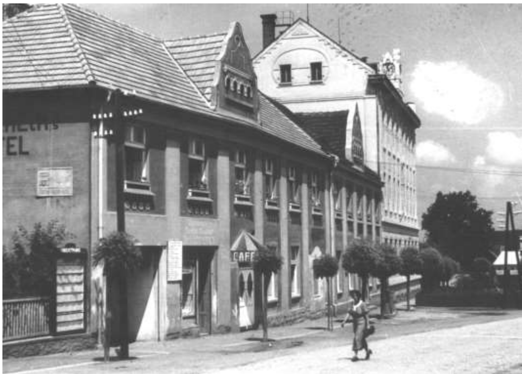
Podoba školy mezi dvěma světovými válkami.

Díky široké vzdělávací, výchovné i rehabilitační nabídce a možnosti ubytování je velmi žádanou školou pro děti se speciálními vzdělávacími potřebami z celého Středočeského kraje, v některých případech i ze vzdálenějších míst.